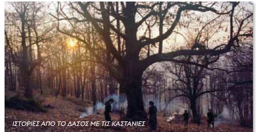
ΙΣΤΟΡΙΕΣ ΑΠΟ ΤΟ ΔΑΣΟΣ ΜΕ ΤΙΣ ΚΑΣΤΑΝΙΕΣ

• Η ταινία έκανε την παγκόσμια πρώτη της στο διεθνές φεστιβάλ του Μπουσάν το 2016, προβλήθηκε τον Νοέμβριο του 2016 στο Διαγωνιστικό Τμήμα του 57ου Διεθνούς Φεστιβάλ Κινηματογράφου Θεσσαλονίκης, όπου και απέσπασε τρία Βραβεία.