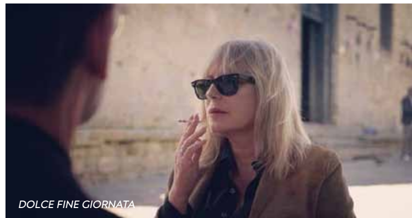
DOLCE FINE GIORNATA

Η ολοκλήρωση της ταινίας (από τις τελευταίες στο παγκόσμιο σινεμά που κινηματογραφήθηκε σε 35mm), λόγω οικονομικών αλλά και γραφειοκρατικών προβλημάτων, χρειάστηκε 10 ολόκληρα χρόνια.