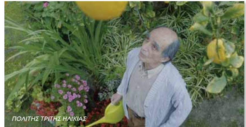
ΠΟΛΙΤΗΣ ΤΡΙΤΗΣ ΗΛΙΚΙΑΣ