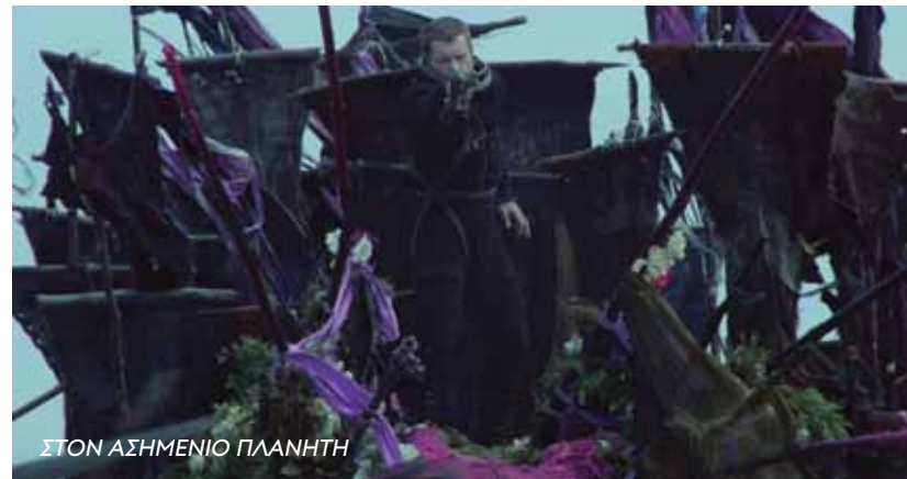
ΣΤΟΝ ΑΣΗΜΕΝΙΟ ΠΛΑΝΗΤΗ

• Η ταινία αποτελεί την εμπορικότερη ταινία του 2015 και την εμπορικότερη ελληνική ταινία της δεκαετίας 2010-2019.